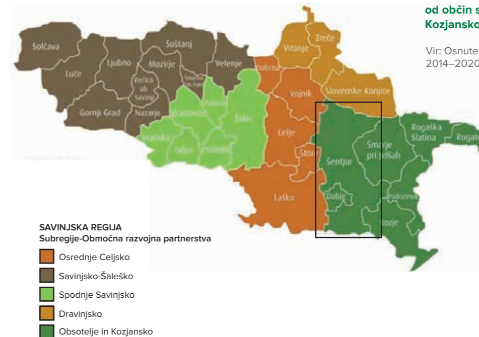
Slika 4: Občina Šentjur kot ena od občin subregije Obsotelje in Kozjansko v Savinjski regiji

Občina Šentjur je ena od sedmih občin (slika 4), ki sestavljajo Območno razvojno partnerstvo Obsotelje in Kozjansko, katerega aktivnosti so določene z Območnim razvojnim programom Obsotelja in Kozjanskega 2014–2020 .