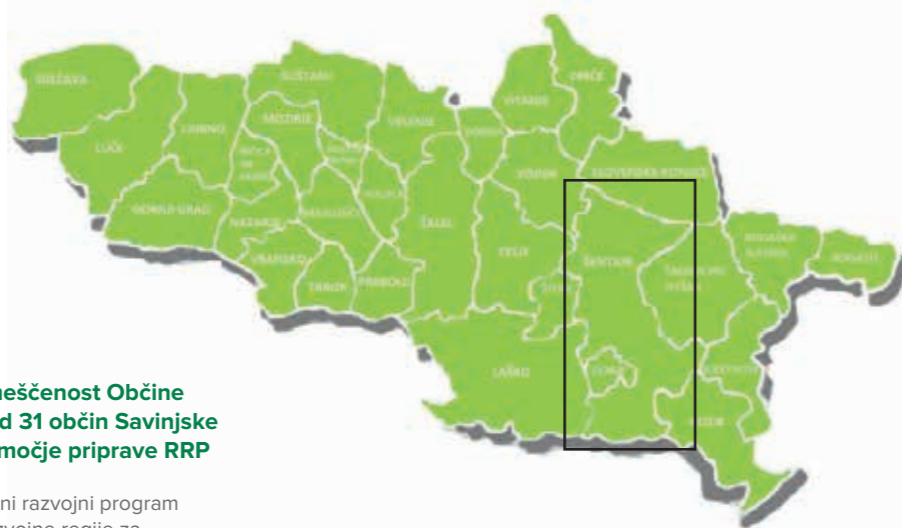
Slika 3: Umeščenost Občine Šentjur med 31 občin Savinjske regije – območje priprave RRP

Občina Šentjur je ena od enaintridesetih občin umeščenih v Savinjsko regijo, območje priprave dokumenta Regionalni razvojni program Savinjske razvojne regije za obdobje 2014–2020 (slika 3).